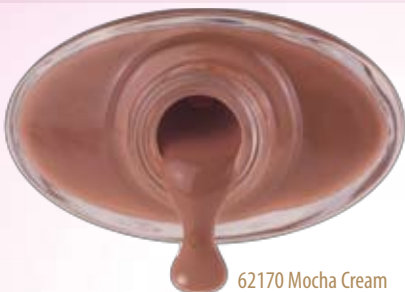
62170 Mocha Cream