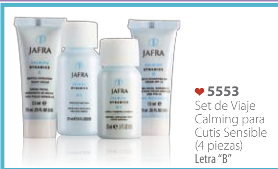
♥ 5553 Set de Viaje Calming para Cutis Sensible (4 piezas) Letra "B"