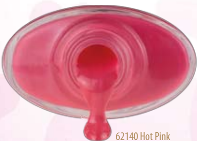
62140 Hot Pink