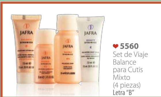
♥ 5560 Set de Viaje Balance para Cutis Mixto (4 piezas) Letra "B"