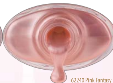
62240 Pink Fantasy