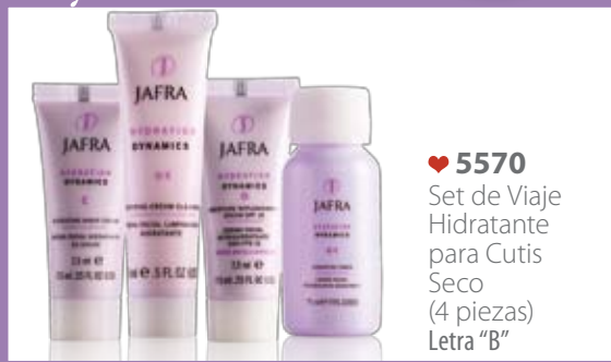
♥ 5570 Set de Viaje Hidratante para Cutis Seco (4 piezas) Letra "B"