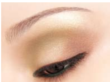
Dúo de Sombras para Párpados Siena.