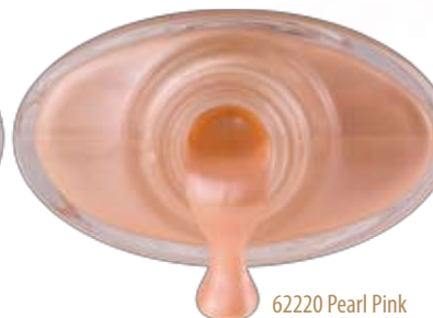
62220 Pearl Pink