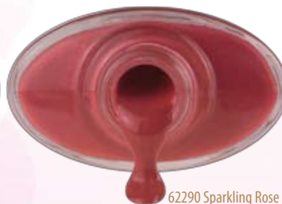
62290 Sparkling Rose