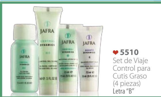
♥ 5510 Set de Viaje Control para Cutis Graso (4 piezas) Letra "B"