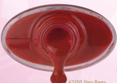
62350 Very Berry